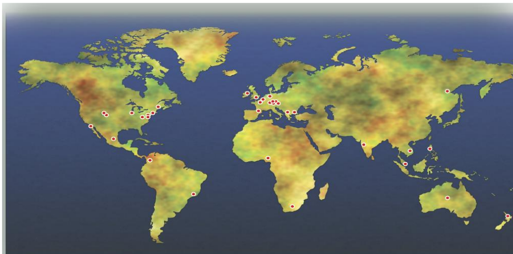
Figure 4: Spectrum Occupancy Measurement Campaigns

Wireless Innovation Forum Dynamic Spectrum Sharing Annual Report